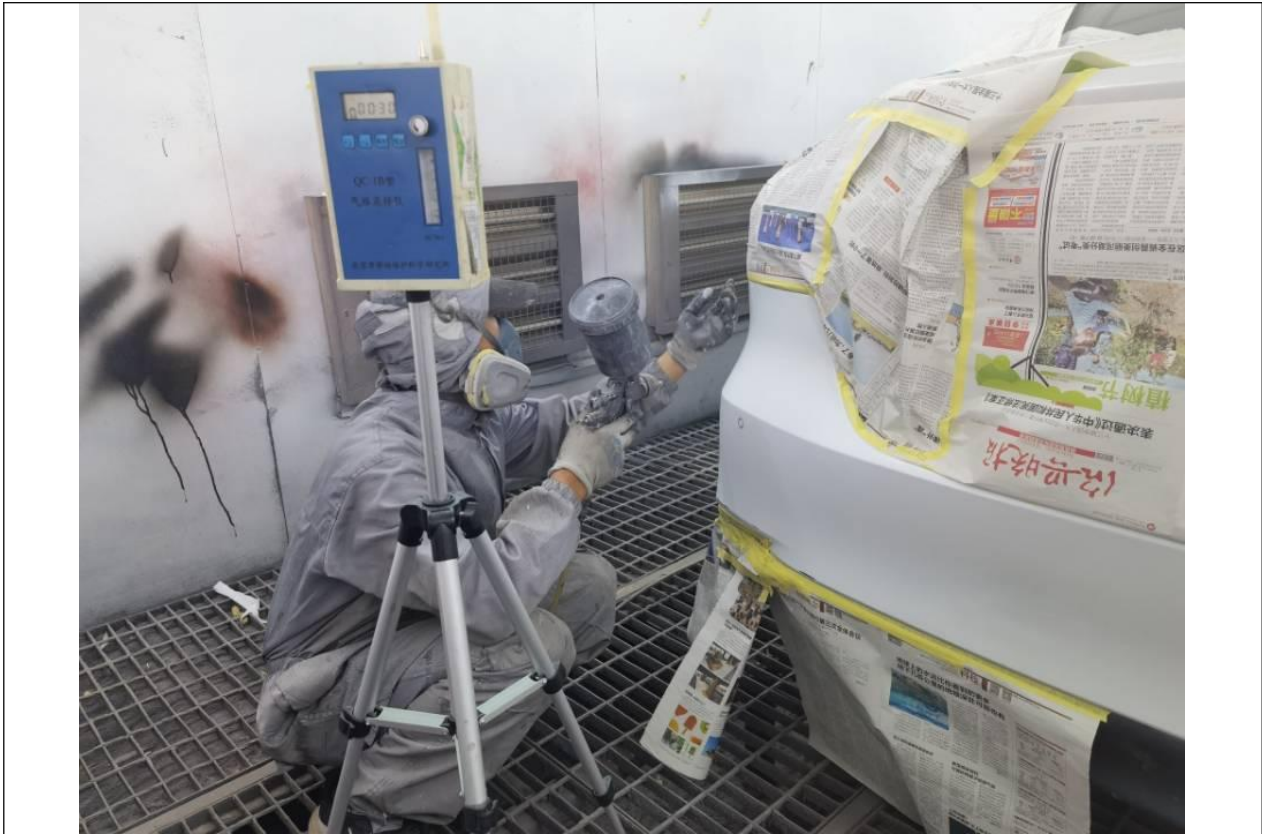
钣喷车间，喷漆岗位