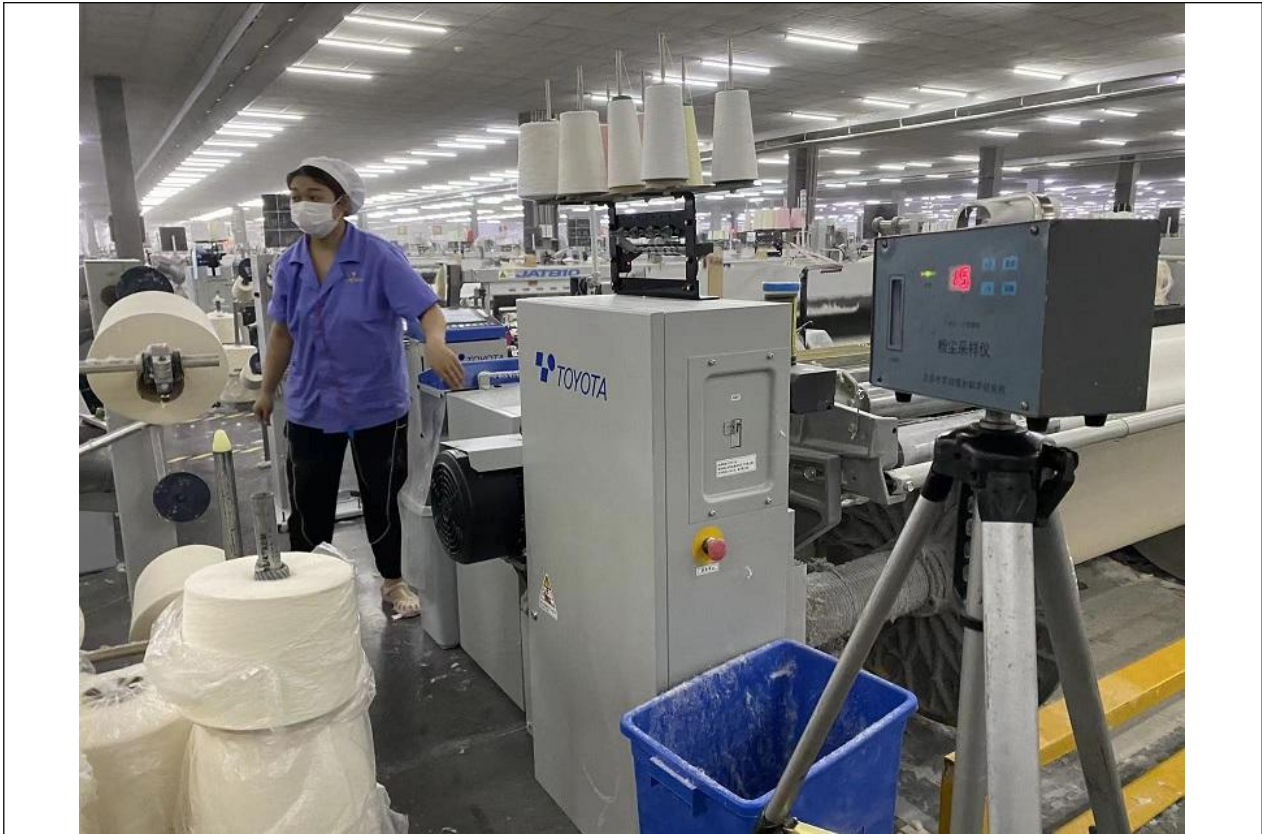
织布车间，织布岗位