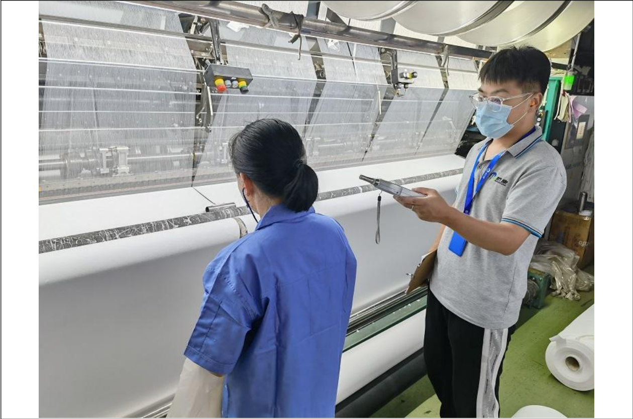
备注：织造车间，织造岗位